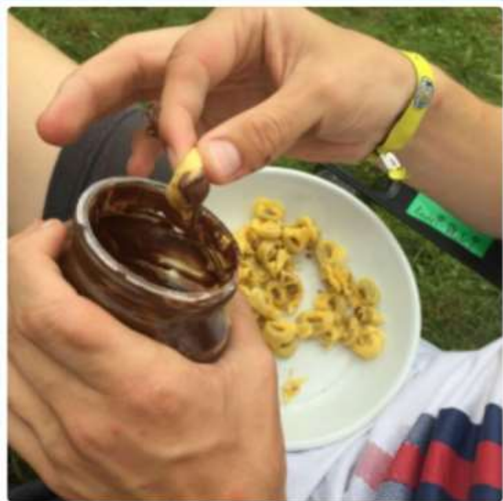
Tortellini mit Nutella in Sudheim als Nachtisch