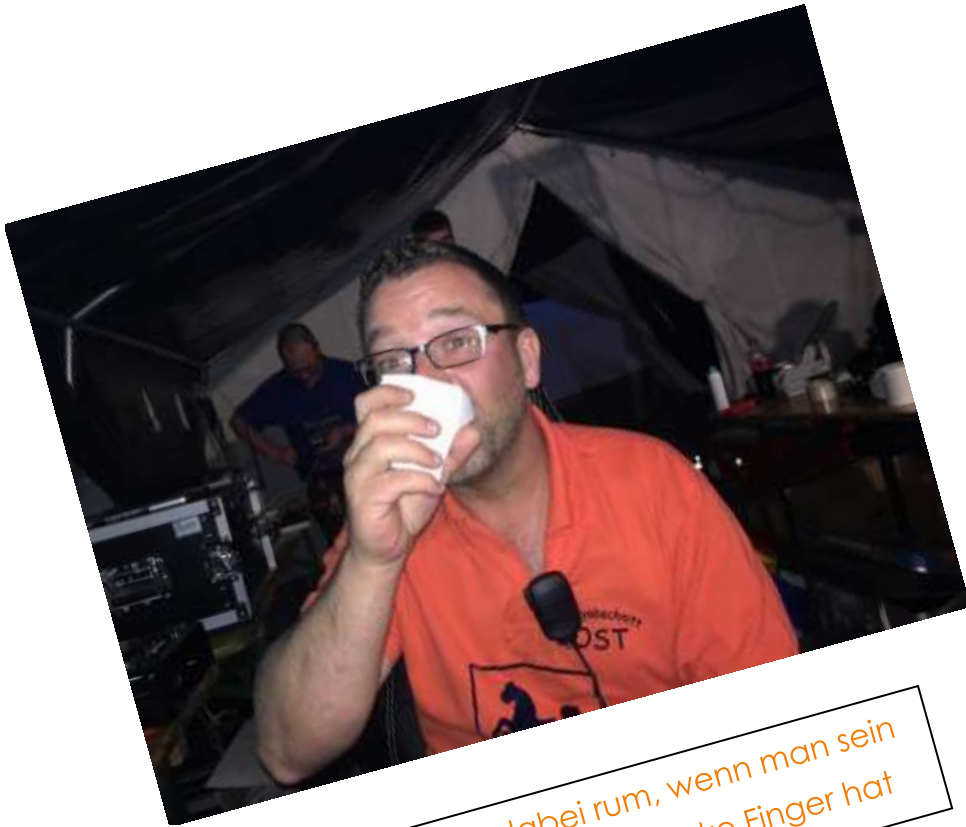
Das kommt dabei rum, wenn man sein Bierglas vergisst, aber flinke Finger hat