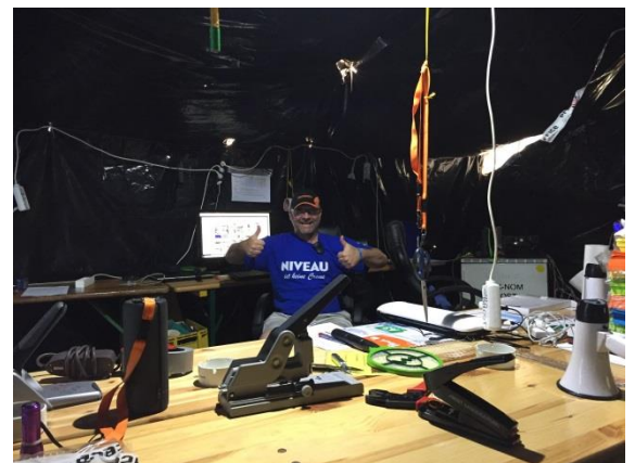
HOME BUTTON RECHTS (RICHTIG)