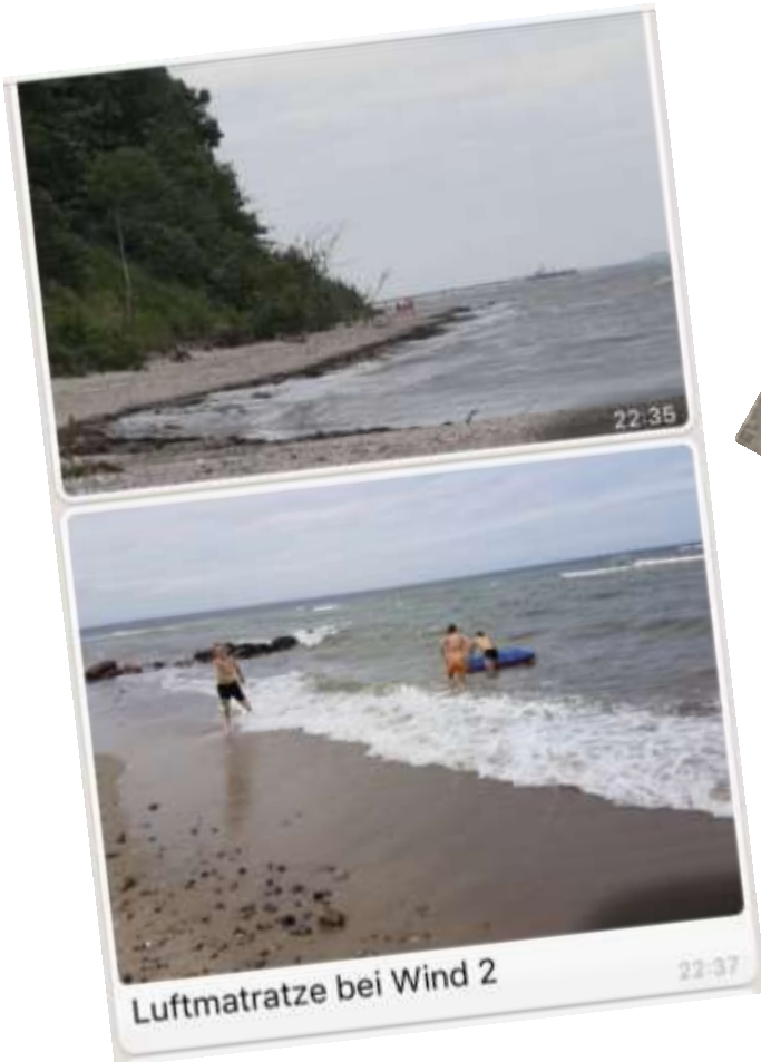
Luftmatratze bei Wind 2