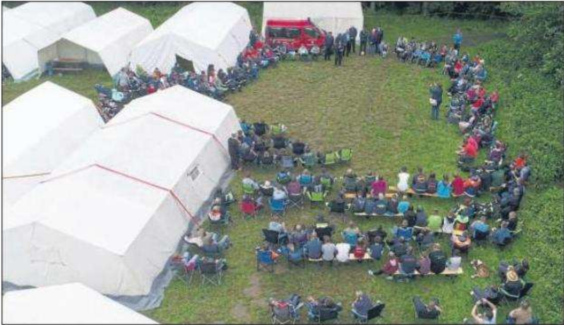
Eröffnung hoch oben im Norden: Die Jugendfeuerwehren aus dem Brandabschnitt Ost sind erstmals in der Gemeinde Schwedeneck zu Gast.