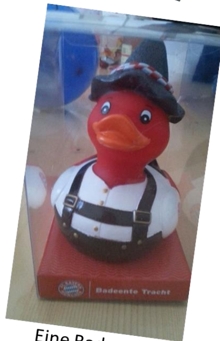
Eine Badeente für Schmale