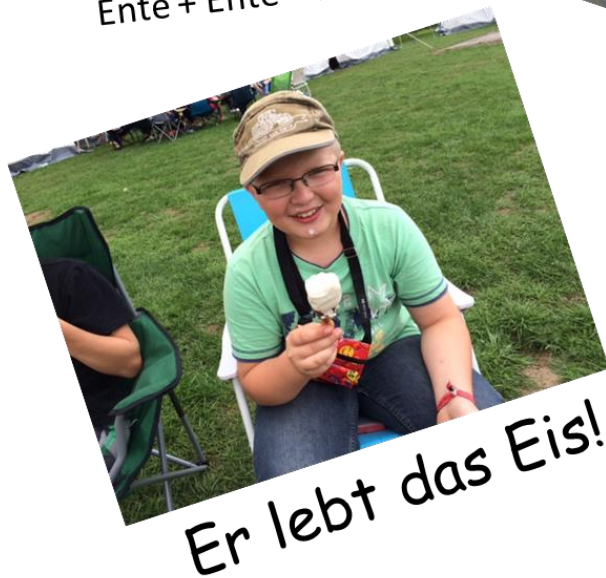
Er lebt das Eis!