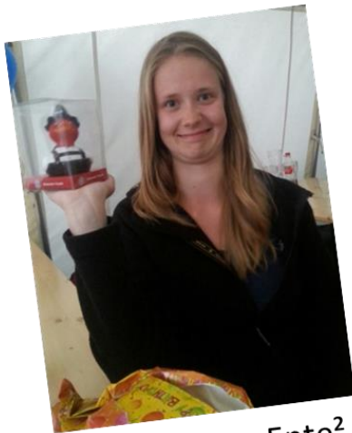
Ente + Ente = Ente 2